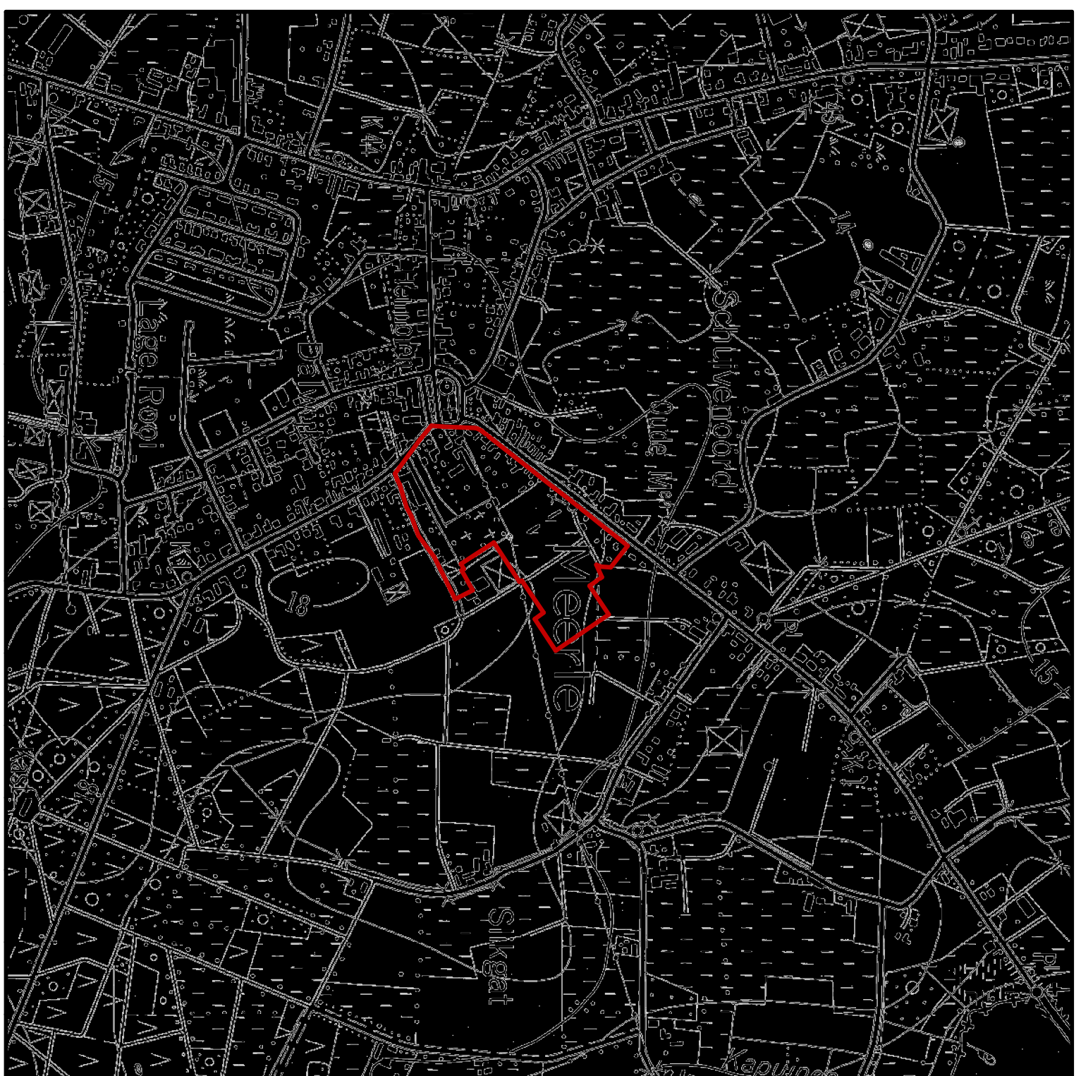
Situering schaal 1/10 000