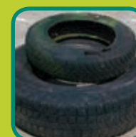
autobanden maximum 4 stuks per maand