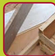
B-hout gelijmd of samengesteld hout