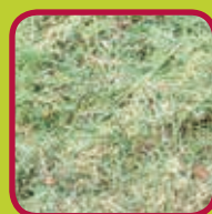
gras 0,10 euro/kg