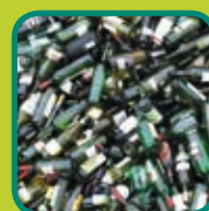
glazen flessen en bokalen ontdaan van etensresten