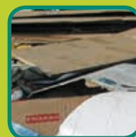
papier en karton dozen leegmaken en open vouwen