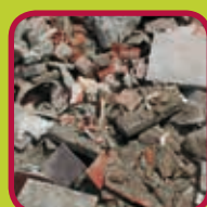
steen- en betonpuin 200 kg/jaar gratis > 200 kg/jaar: 0,03 euro/kg