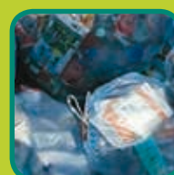
PMD verplicht aanleveren in blauwe PMD-zak