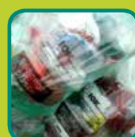
gemengde plastic verplicht aanleveren in groene zak met opdruk IOK Afvalbeheer