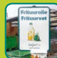
frituurolieën en -vetten