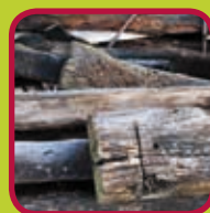
C-hout geïmpregneerd hout of behandeld met carboline

200 kg/jaar gratis - > 200 kg/jaar 0,15 euro/kg