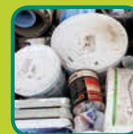
Klein Gevaarlijk Afval (KGA) verplicht melden aan de recyclageparkwachter