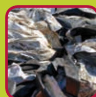
land- en tuinbouwfolies 0,15 euro/kg