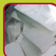
piepschuim wit en zuiver 200 liter: gratis > 200 liter: 6,50 euro

200 kg/jaar gratis - > 200 kg/jaar 0,15 euro/kg