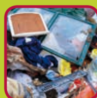
grof vuil 0,20 euro/kg

Huisvuil (restafvalzakken) wordt NIET aanvaard op het recyclagepark.