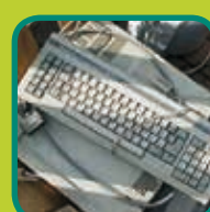
AEEA Afgedankte Elektrische en Elektronische Apparaten