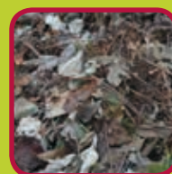
tuinafval (geen gras) 200 kg/jaar gratis > 200 kg/jaar: 0,10 euro/kg