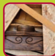
A-hout zuiver massief hout